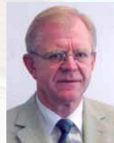
Friedrich Krauser Erster Beigeordneter des Wartburgkreises