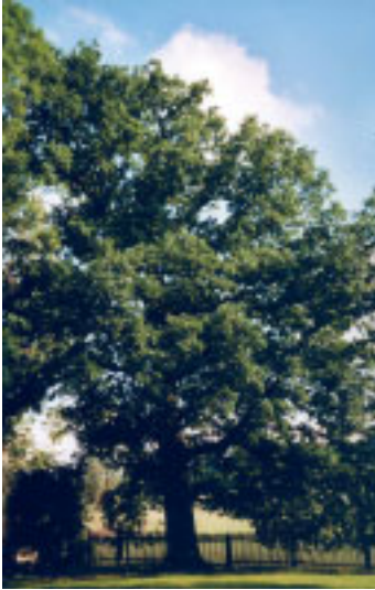
Bild 21: Stieleiche Standort: Stockhausen, im Garten „Zum Wehr“ Stammumfang: 396 cm