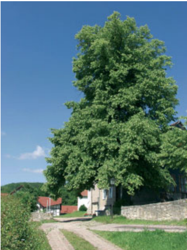
Bild 17: Linden Standort: Stedtfeld, Am Lindenrain Stammumfang: 290 u. 340 cm