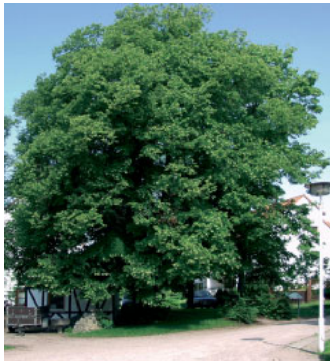
Bild 18: Kastanie Standort: Stedtfeld, Hopfental Stammumfang: 400 cm