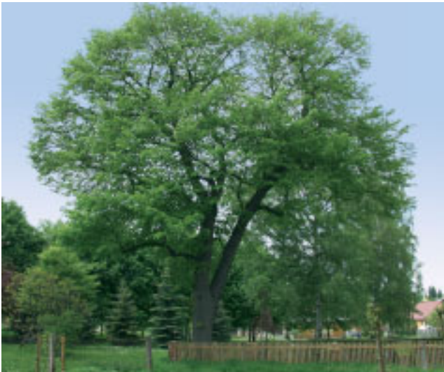
Bild 12: Trauerweide Standort: Neuenhof, Hörscheler Straße Stammumfang: 310 cm

Bild 13: Linde Standort: Neuenhof, Warthaer Straße, An der Schule Stammumfang: 350 cm