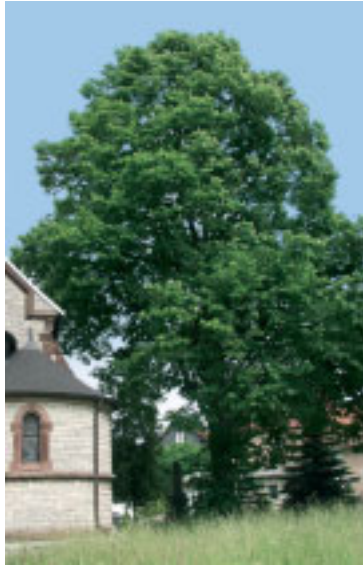
Bild 10: Birke Standort: Madelungen, Max-Kürschner-Straße Stammumfang: 200cm