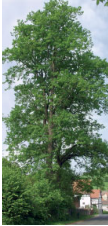
Bild 4: Linden Standort: Eisenach, Am Steingraben, unter- halb vom Ziegelfeld Stammumfang: 390 und 365 cm

Bild 5: Linde und Eiche Standort: Göringen, Lauchröder Straße Stammumfang: 210 und 180 cm