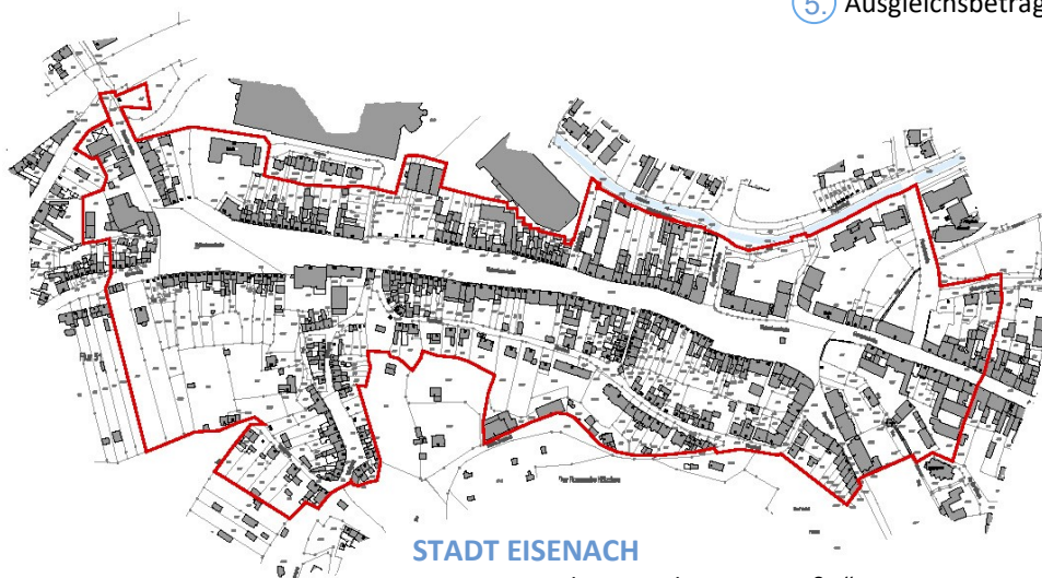
STADT EISENACH Sanierungsgebiet „Katharinenstraße“