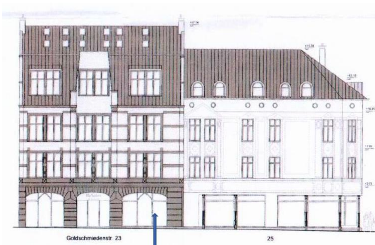
Abbildung 2: Vorderansicht