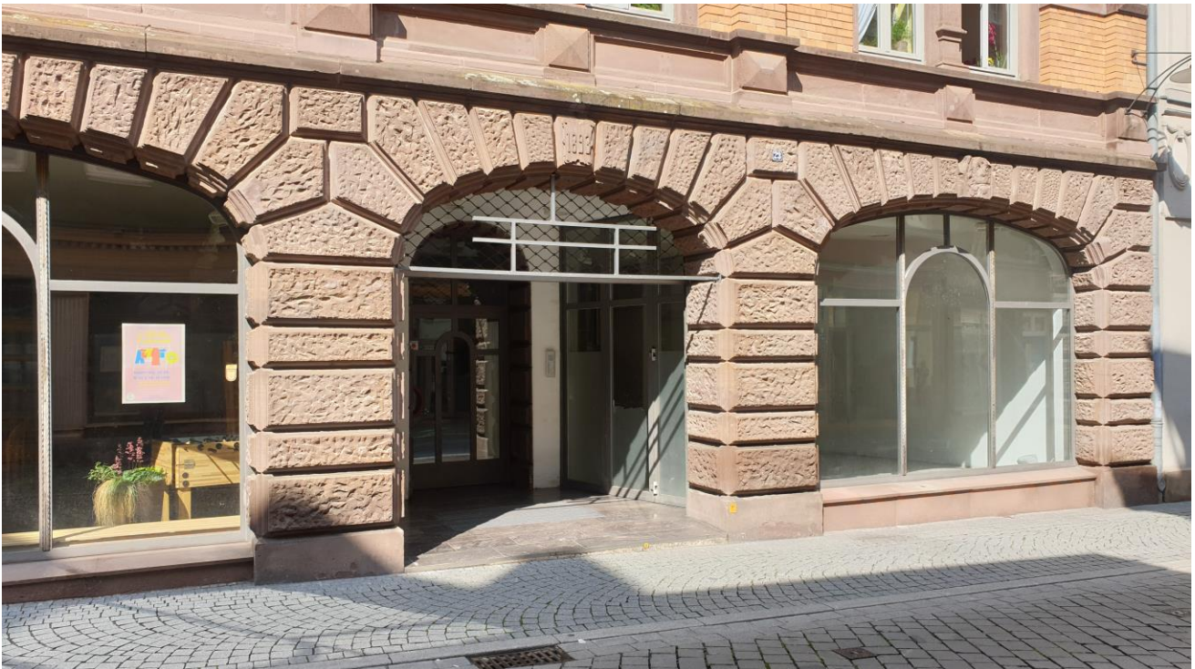
Abbildung 1: Erdgeschossseinheit von außen