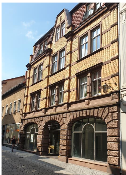
Abbildung 3: Vorderansicht gesamtes Gebäude