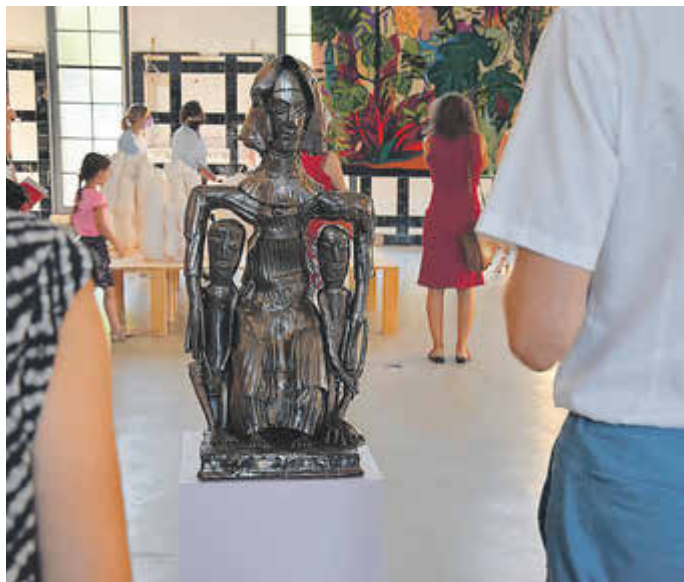
Gäste der Ausstellungseröffnung stehen vor einem der Werke von Hermann Grüneberg.