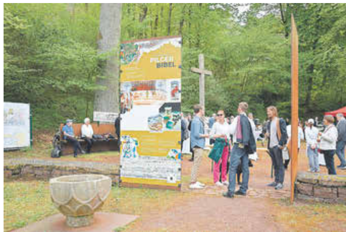
Die Eisenacher Pilgerbibel zeigt alle 3333 Bilder, die der Stuttgarter Künstler Willy Wiedmann gemalt hat.

Jeden Sonntag um 14 Uhr finden öffentliche Führungen durch die Eisenacher Pilgerbibel statt. Eisenacher Gästeführer*innen geben während der 90-minütigen Führung spannende Einblicke zum Hintergrund der Ausstellung in Eisenach, dem Leben und Werk Willy Wiedmanns und erzählen Geschichten zu den Bildern der Wiedmann Bibel. Tickets sind in der Tourist-Info oder online erhältlich.