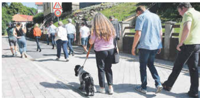
Eingebaute Schwellen tragen zur Verkehrsberuhigung bei.