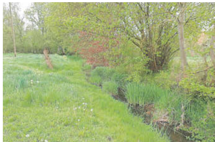
An Uferböschungen der Region wird zur Zeit das Gras gemäht.