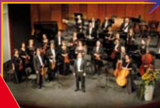
landes theater eisenach