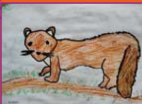
Evelyn Stadel, 7 Jahre