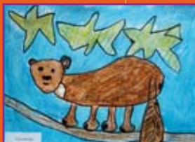
Friederike Thimm, 7 Jahre