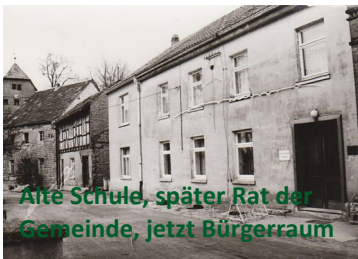
Alte Schule, später Rat der Gemeinde, jetzt Bürgerraum

Beginn: 19.00 Uhr (Der Eintritt ist frei)