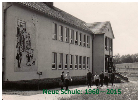
Neue Schule: 1960—2015