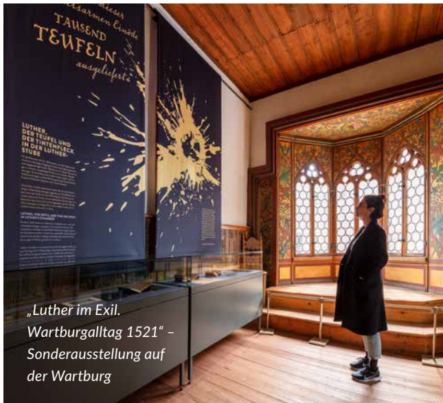
„Luther im Exil. Wartburgalltag 1521“ – Sonderausstellung auf der Wartburg