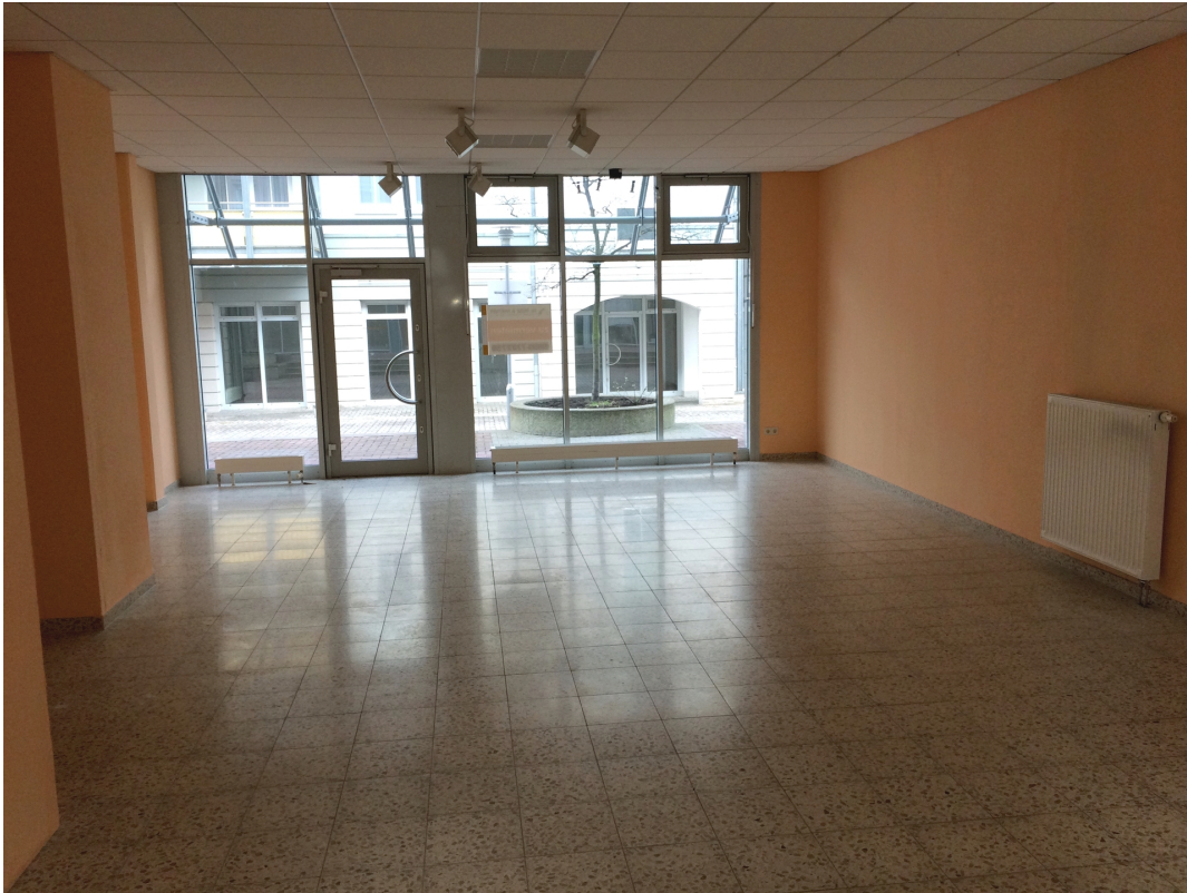
ursprüngl. Gewerbefl. Ans. 1