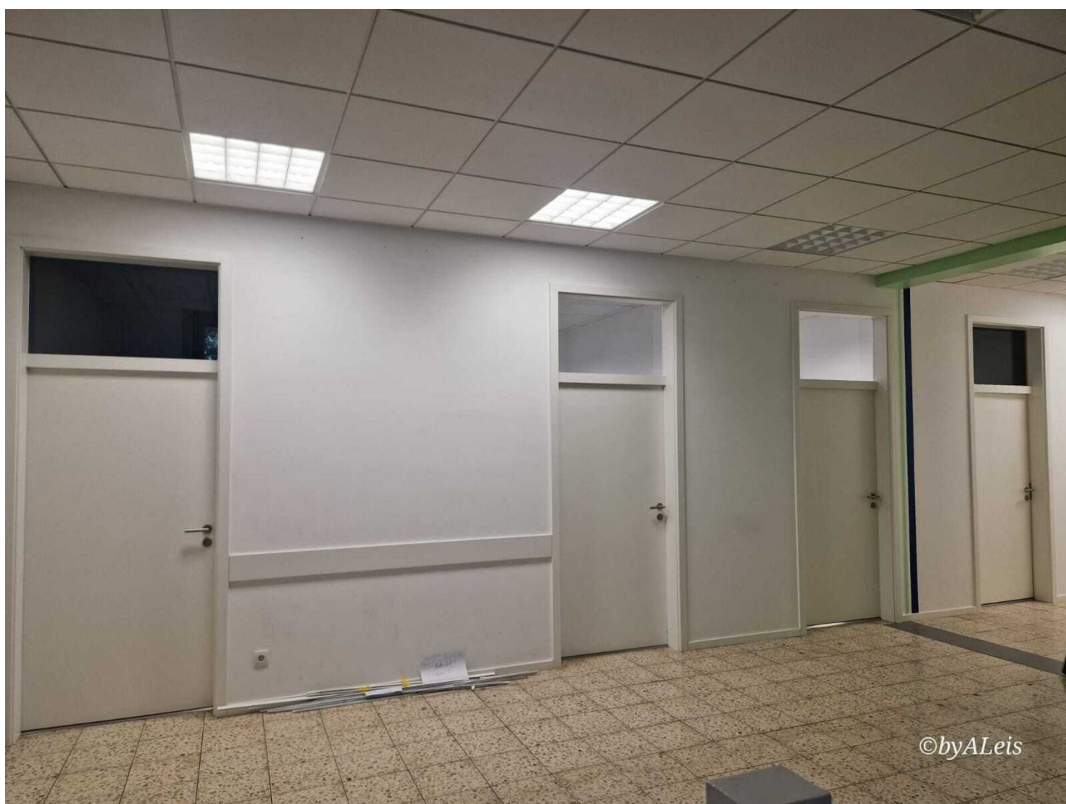
Blick auf Praxisräume