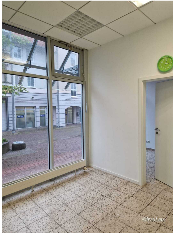
Eingangsbereich Ans. 2