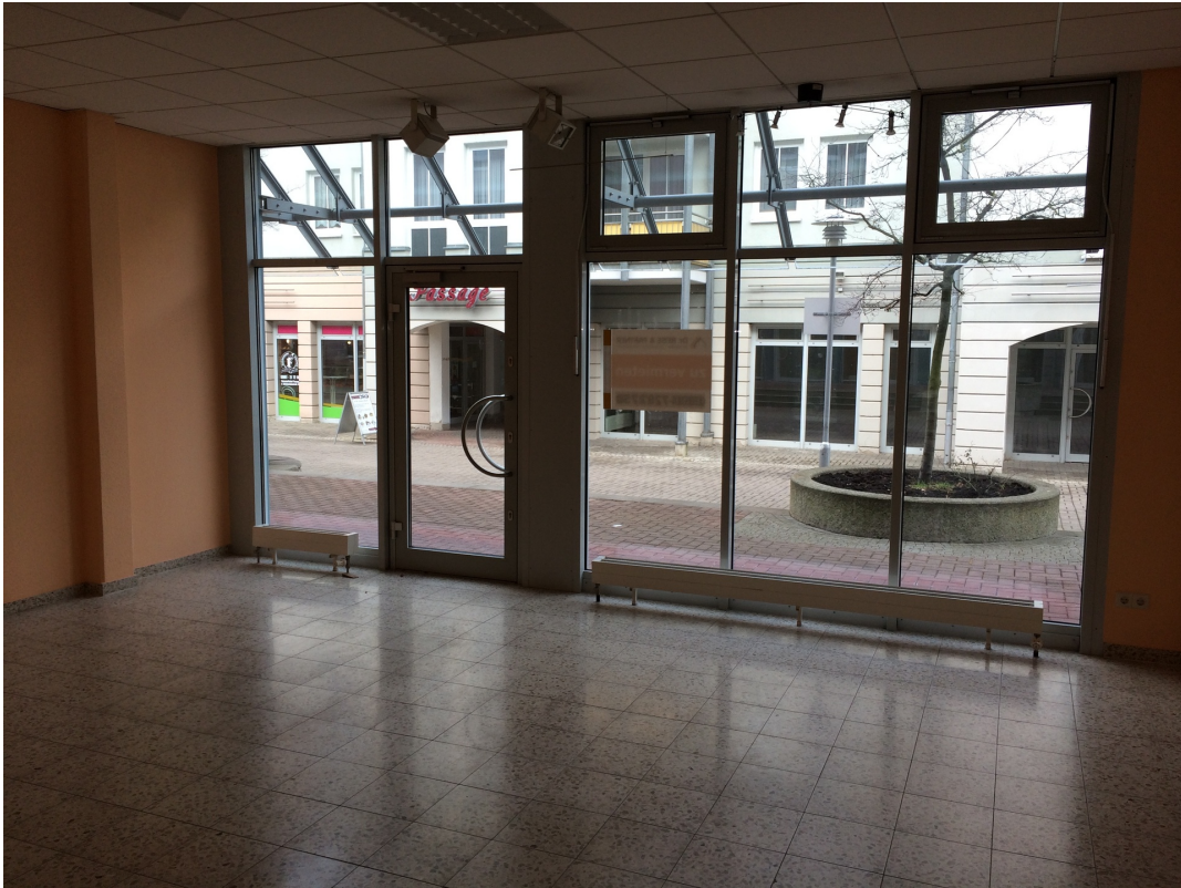
ursprüngl. Gewerbefl. Ans. 3