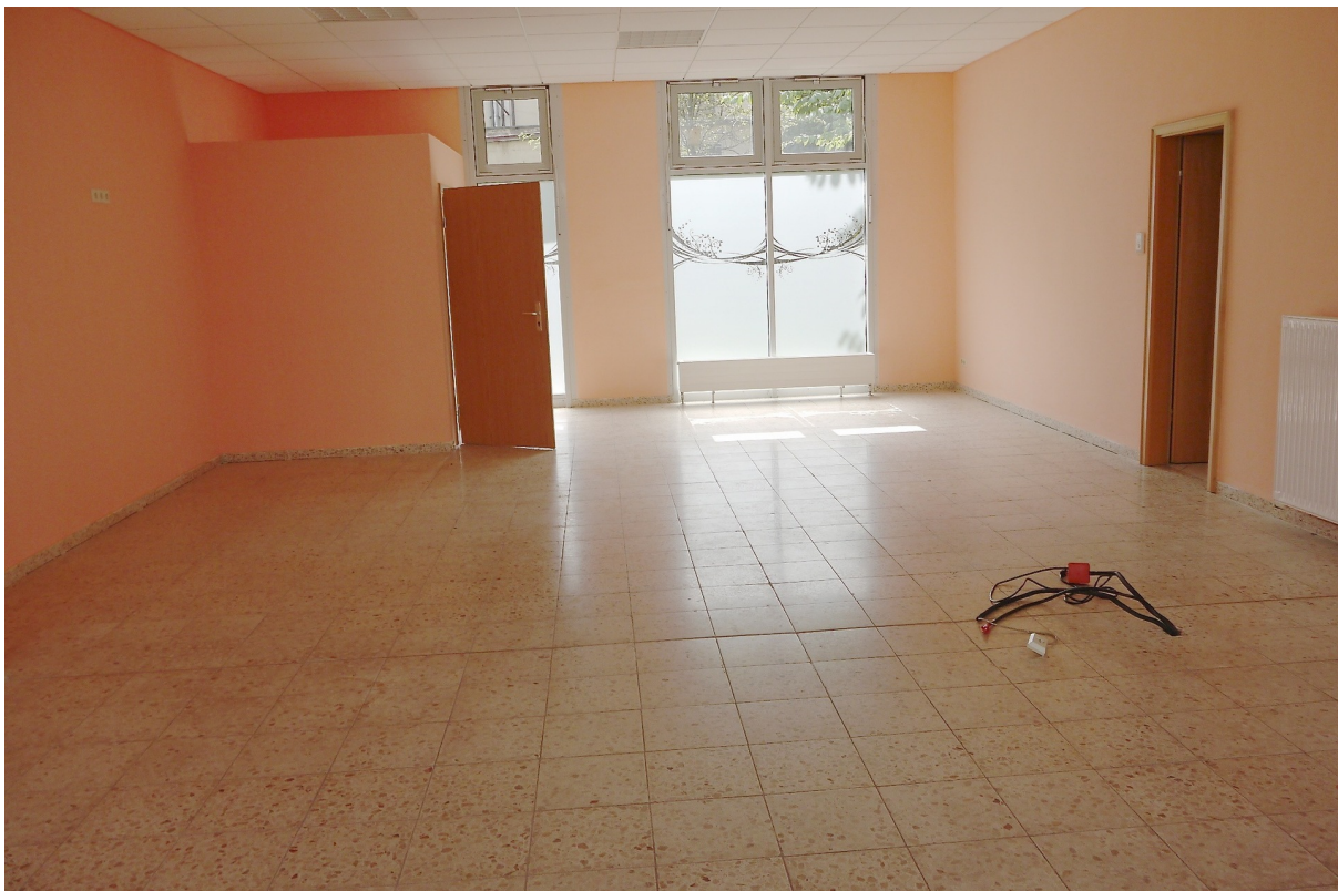
ursprüngl. Gewerbefl. Ans. 2