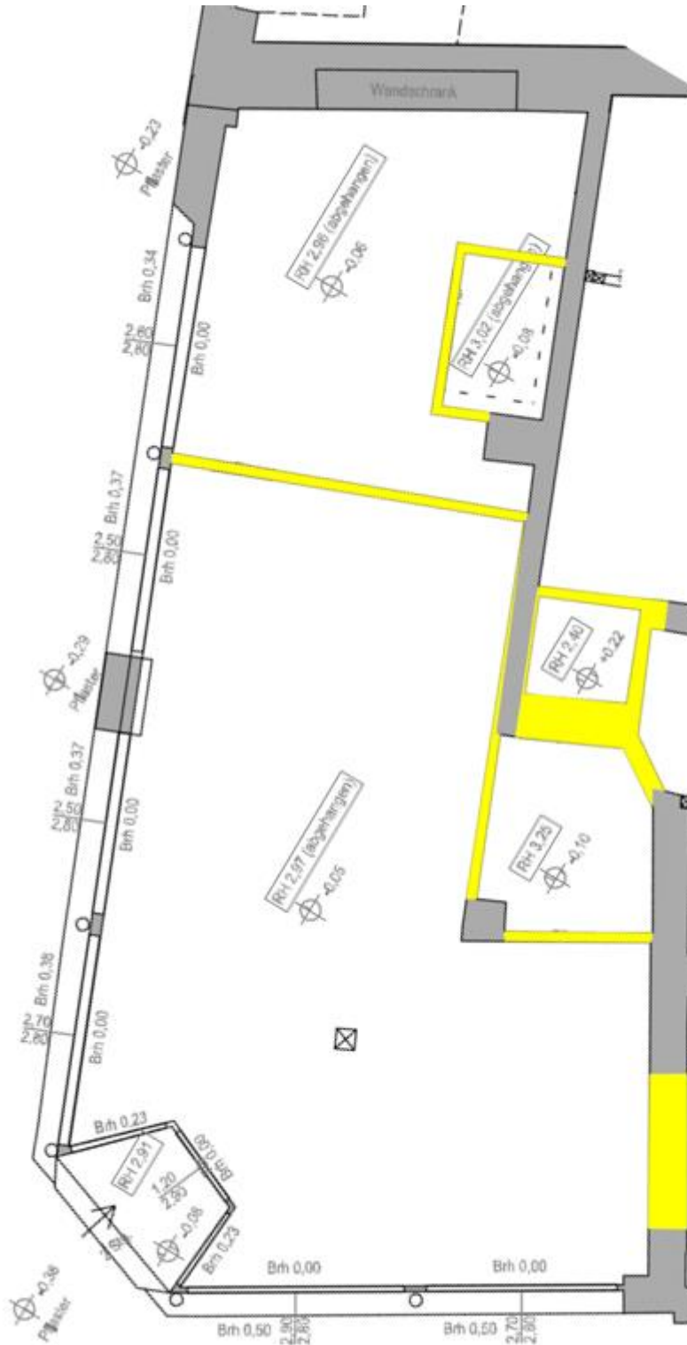
Abbildung 4: Grundriss