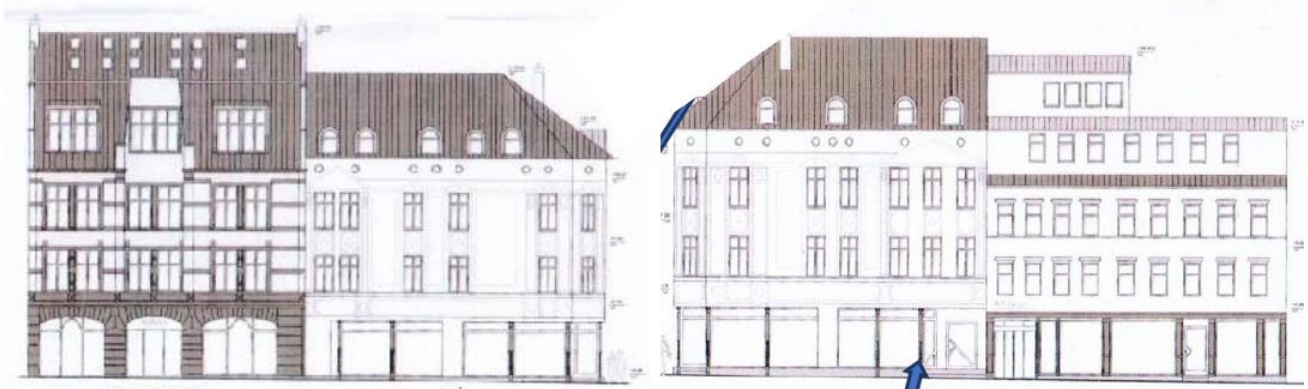
Abbildung 5: Vorderansichten Variante 2