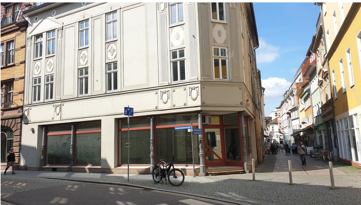
Abbildung 1: Erdgeschossseinheit von außen