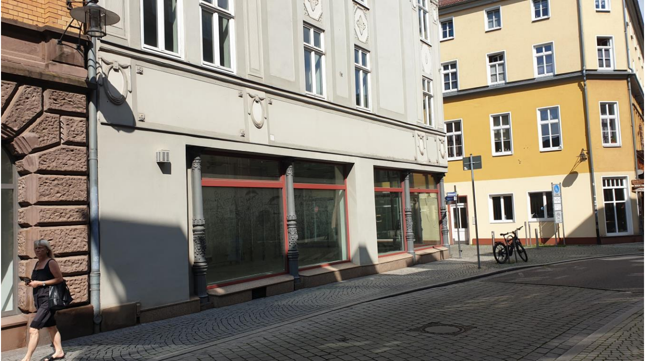
Abbildung 2: Ansicht Goldschmiedenstraße